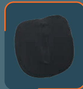
REF. 70020 Hohe Lumbalpelotte