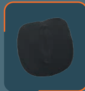
REF. 70020 pelotte lombair haute