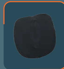
Option: REF. 70020 pelotta rigida alta