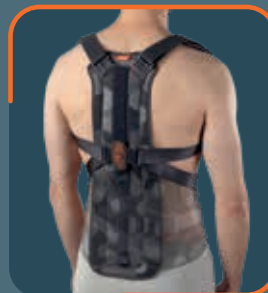
REF. 90074 Schienale per spallaccio DorsoPull 74