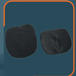
REF. 70010 niedrige Lumbalpelotte REF. 70020 hohe Lumbalpelotte